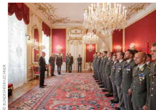
Die Teilnehmer des Lehrganges in der Präsidentschaftskanzlei