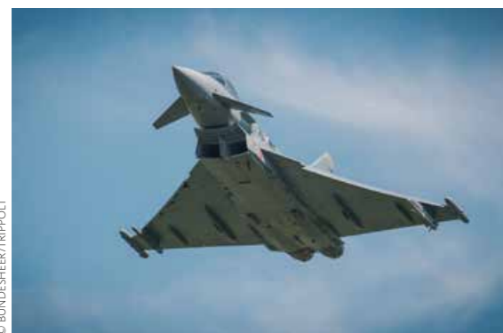
Auch die Luftstreitkräfte präsentieren ihre Leistungsfähigkeit.

/ Dank der Führung durch die Offiziere der Militärakademie, der Mitwirkung von 15 verschiedenen Einheiten aus dem ganzen Bundesgebiet und der guten Unterstützung durch den Truppenübungsplatz Allentsteig war die Lehrvorführung 2019 ein voller Erfolg. (BMLV) ✕