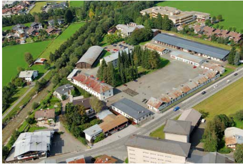
Ein Beispiel für eine dringende Sanierung – Winterstellerkaserne/St. Johann in Tirol