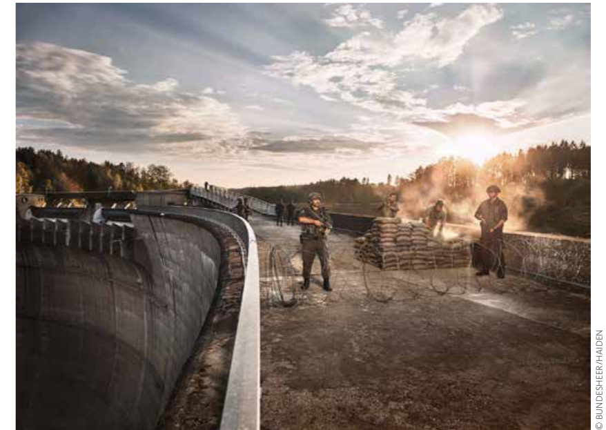
Schutz kritischer Infrastruktur. Die Miliz soll im Ernstfall die Sicherung von strategisch wichtigen Infrastruktureinrichtungen wie Tanklagern, Umspannwerken oder Krankenhäusern übernehmen.

Hameseder: „Der beste Ausdruck der Wehrwilligkeit eines Volkes ist der Bürger in Uniform, den die Miliz repräsentiert. Es bietet flexible Reaktionsmöglichkeiten, die militärischen Kräfte lageangepasst anzubieten. Dabei unterscheidet uns das Milizsystem von den anderen Staaten in Europa. Eine andere Form der Armee wäre ein Berufsheer, das nicht nur zahlenmäßig wesentlich kleiner wäre, ▶