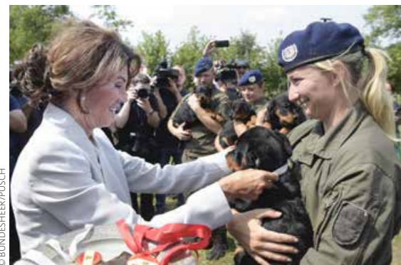
Bundeskanzlerin Bierlein übernahm die Patenschaft über zwei Welpen.