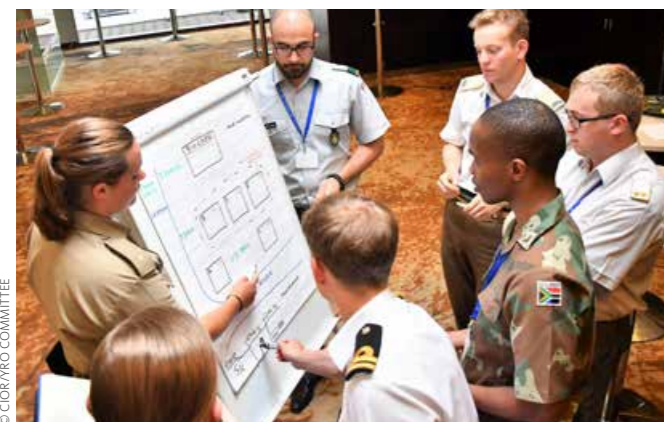
Operation Planning Process (OPP) im internationalen Rahmen

Abschließend lässt sich also zusammenfassen, dass eine Teilnahme österreichischer Offizierinnen und Offiziere des Milizstandes darin liegt, neue Sichtweisen, neue Herangehensweisen, aber auch mögliche neue Best Practices kennenzulernen, um somit auch beim Bundesheer einen ständigen Verbesserungsprozess zu ermöglichen. ✕