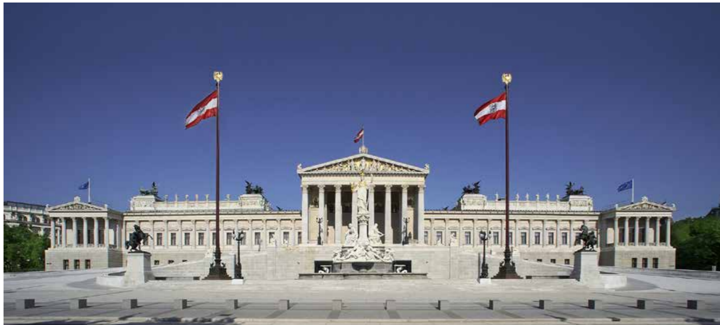
Blick auf die Fassade des Parlamentsgebäudes von der Ringstraßenseite