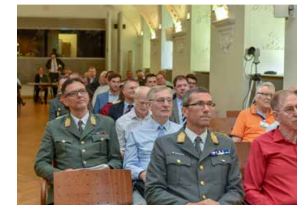
Ein Blick ins Publikum