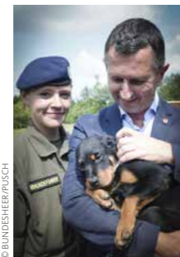
Der Verteidigungsminister mit einem der frisch getauften Welpen