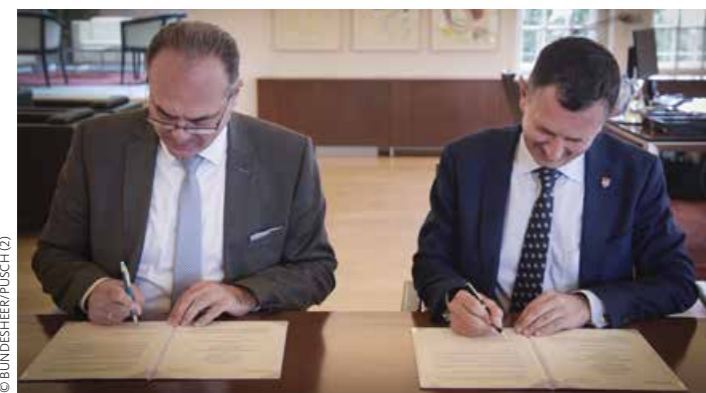
Die Bundesminister Andreas Reichhardt und Thomas Starlinger, r., unterzeichneten ein gemeinsames Kooperationsabkommen.

/ FORTE steht in der Programmverantwortung des BMVIT und wird inhaltlich jedoch in enger Koordination mit dem BMLV abgewickelt. Unter der ersten Tranche erfolgreich eingereichter Projekte findet sich etwa der Schutz kritischer Infrastruktur wie Strom, Wasser oder auch Lebensmittellager vor Drohnenschwärmen. FORTE ist daher ein Musterbeispiel, wie auch in der angewandten Forschung BMVIT und BMLV bei gesamtstaatlichen Herausforderungen zusammenarbeiten. (BMLV) ✕