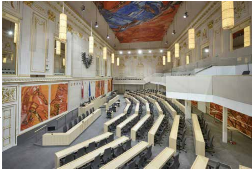
Seitenansicht des Plenarsaals von National- und Bundesrat im Großen Redoutensaal in der Hofburg mit Bildern von Josef Mikl