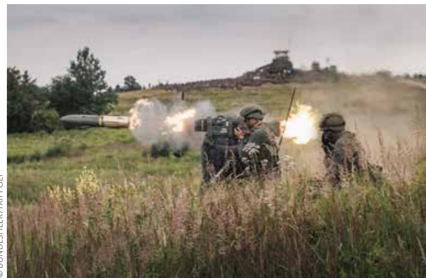
Abschuss einer Panzerabwehrwaffe