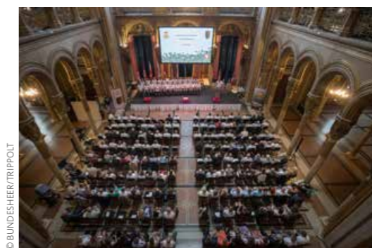
In der Ruhmeshalle des Heeresgeschichtlichen Museums