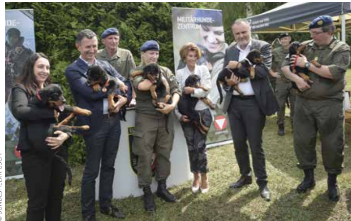
Die Bundesminister Ines Stilling und Thomas Starlinger, Bundeskanzlerin Brigitte Bierlein und Landeshauptmann Hans Peter Doskozil mit dem Hundenachwuchs