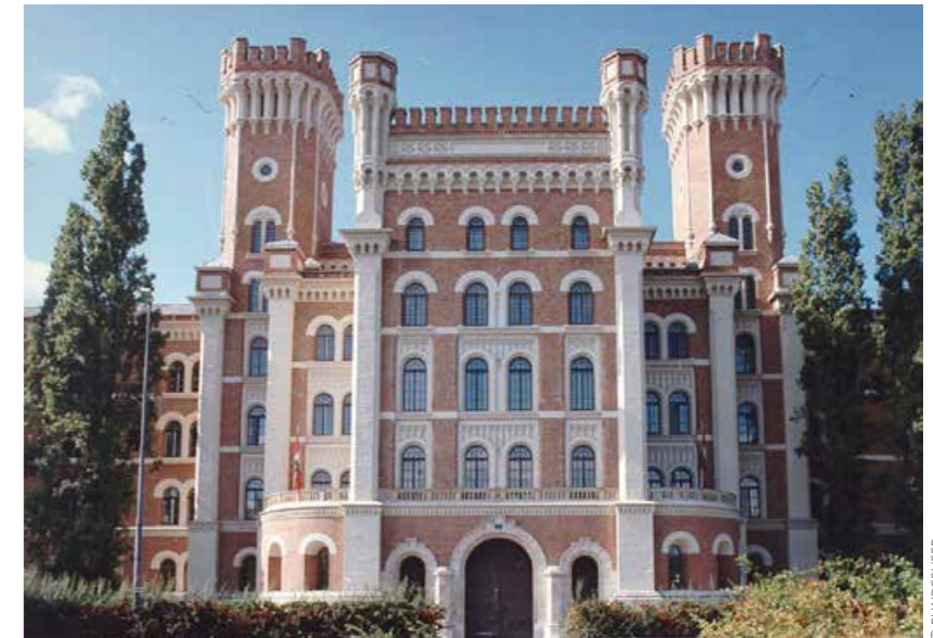
Kasernen aus dem 18. und 19. Jahrhundert haben eine große Anziehungskraft – beispielsweise die Rossauerkaserne in Wien, der Sitz des Bundesministeriums für Landesverteidigung und ehemals Infanteriekaserne.

Geht man auf eine echte oder eine virtuelle Weltreise, beispielsweise mit Google Earth, so