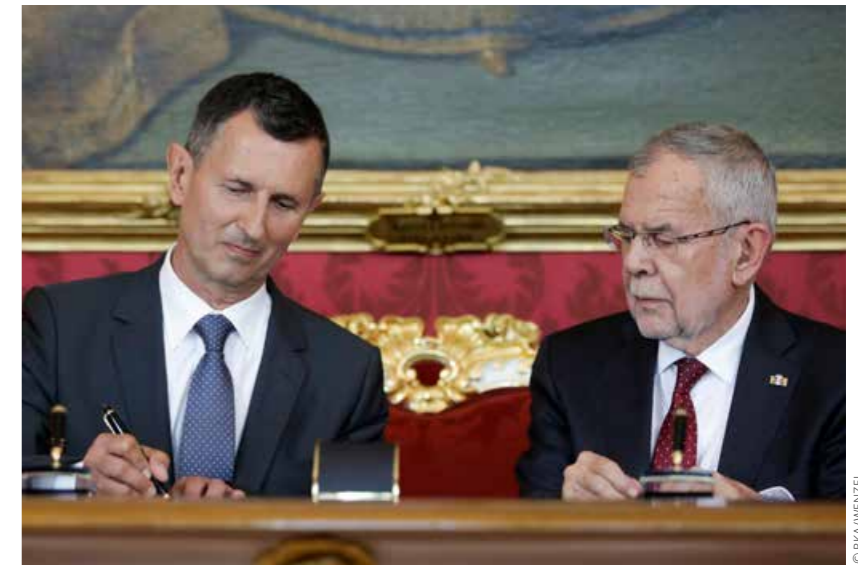
Bundespräsident Alexander Van der Bellen mit Bundesminister Thomas Starlinger

/ Ich habe den Auftrag erteilt, bis Mitte September dieses Jahres einen Zustandsbericht zu erstellen, der im Detail aufzeigen wird, welche Rahmenbedingungen erforderlich sind, um den Schutz der österreichischen Bevölkerung auch in Zukunft noch gewährleisten zu können. Diese