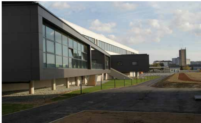
Das Kommandogebäude in der Musterkaserne – Montecuccoli-Kaserne, Güssing

präsentieren sich die Fassaden einiger Gebäude dieser Kasernen. Diese zwei Beispiele von österreichischen Kasernen werden verstärkt durch eine Aussage des Generalstabes, nachzulesen in der Broschüre: „Effektive Landesverteidigung – ein Appell“ (verfügbar auf der Homepage des Bundesheeres), wonach etwa 65 Prozent der Infrastruktur größere Instandsetzungsarbeiten oder sogar einen Abbruch und Neubau benötigen und nur etwa zehn Prozent der Infrastruktur sich in einem neuwertigen Zustand befinden.