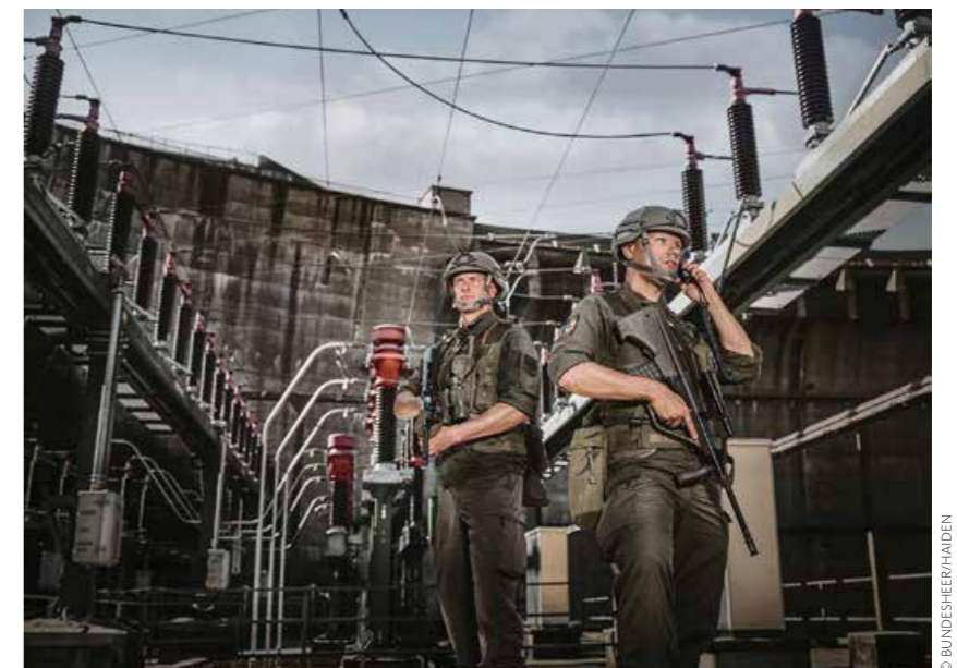
Milizsoldaten beim Training. Für Milizsoldaten bestehen verschiedene Möglichkeiten, Übungen oder Einsätze zu absolvieren.