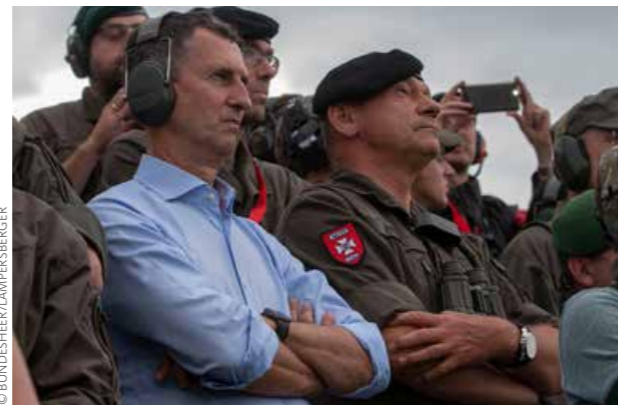
Minister Starlinger, einer der 1.500 Zuschauer

C a. 200 Soldatinnen und Soldaten – 19 gepanzerte Kampffahrzeuge – neun Luftfahrzeuge – 1.500 Zuschauer – die Schießbahn Kühbach am Truppenübungsplatz Allentsteig: Das sind die Eckdaten der am 18. Juli 2019 gezeigten Lehrvorführung im scharfen Schuss „Die Waffensysteme des Bundesheeres“.