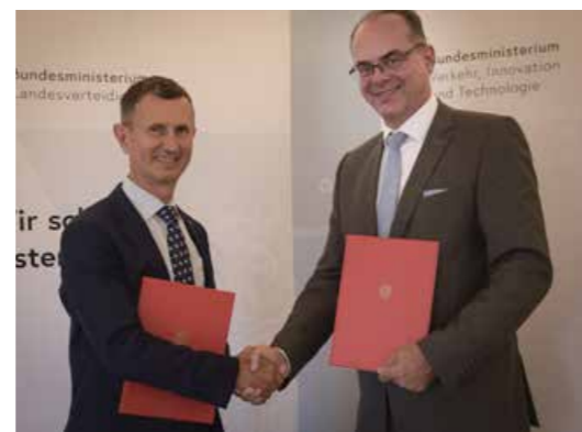
„Neben Forschung und Entwicklung von unbemannten Luftfahrtsystemen soll das gemeinsame Projekt künftig in anderen Bereichen angewandt werden“, so die Minister.