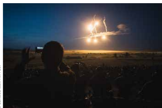
Geheftsbeleuchtung in der Nachtphase der Lehrvorführung