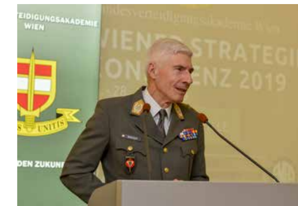
Generalstabschef Robert Brieger bei seinem Vortrag